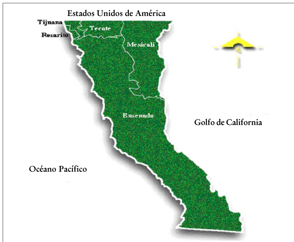
FIGURA 1. Municipios de Baja California

El municipio de Mexicali (véase la figura 1) nació fronterizo e integrado a la economía norteamericana, particularmente a la de California, Estados Unidos, por medio de inversiones directas de empresas de ese país, e indirectamente con base en el abasto e intercambio de bienes que se formaliza con la implantación de un régimen comercial de zona libre. Asimismo, el municipio es producto de